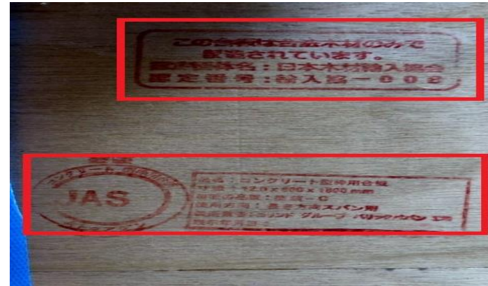
※合法木材、JASの実際の写真