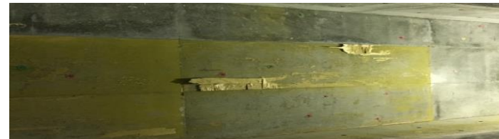
※高強度コンクリート 塗装面の剥がれ